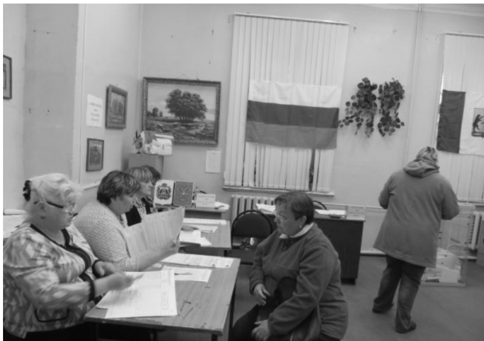
На избирательных участках царит деловая атмосфера