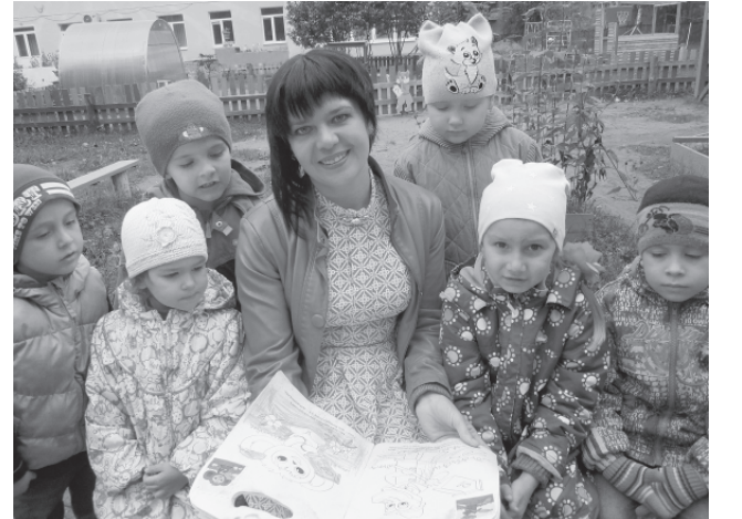
Дружная компания за чтением книги