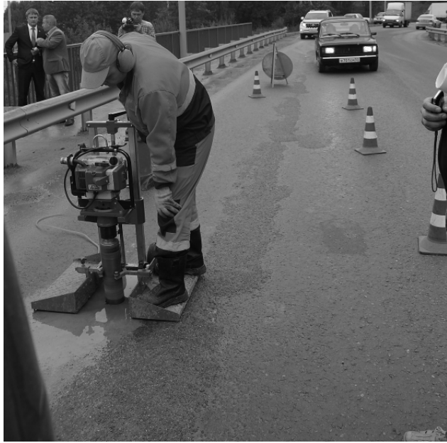
Лаборатория «Новгородавтодора» берёт пробы асфальта на виадукке для независимой экспертизы

Год назад (1 сентября) завершился ремонт путепровода по улице Ржевской. Открытия виадука ждали с нетерпением — автомобилисты устали наматывать километры в объезд. ООО «РИСАД» (авторский надзор) и ООО «Новомост 53» (строительный контроль) вынесли заключение о том, что новое асфальтобетонное покрытие соответствует требованиям ГОСТа, и мост подлежит эксплуатации без ограничений. Провела свои лабораторные исследования и боровичская фирма «Солид», которая, находясь на субподряде у компании «Балтийский регион», и укладывала асфальт. Никаких нарушений обнаружено не было.